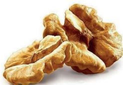
Рисунок 2. Палочка