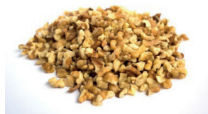
Рисунок 3. Крошка