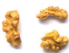
Рисунок 1. Бабочка

Орех поставляется на экспорт преимущественно в Российскую Федерацию. Основными заказчиками являются российские кондитерские цеха и переработчики.